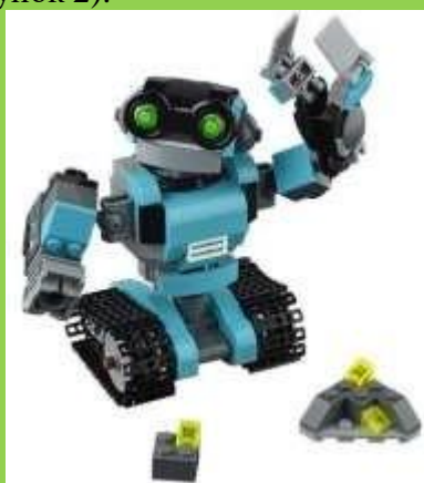
Рисунок 2. Пример готового образца из Лего