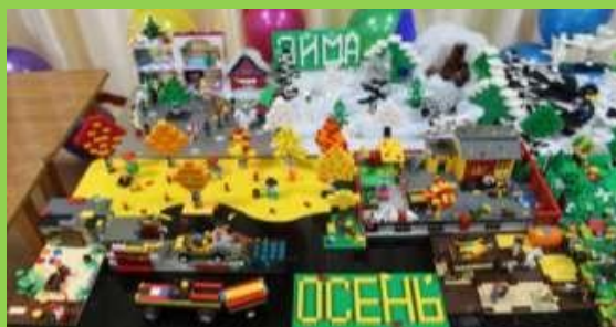
Рисунок 5. Проект «Времена года»

Детям могут быть предложены самые разные темы для лего- конструирования. Например, проект по теме «Времена года» (рисунок 5).