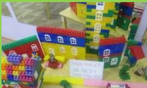
Рисунок 4. Конструирование многоквартирного дома

Примером конструирования по замыслу может быть построение многоквартирного дома (рисунок 4).